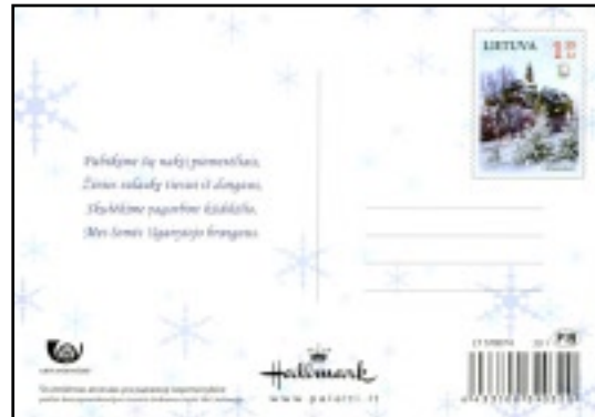
ZA 6 1,35 Lt – Kalėdų vaizdelis.