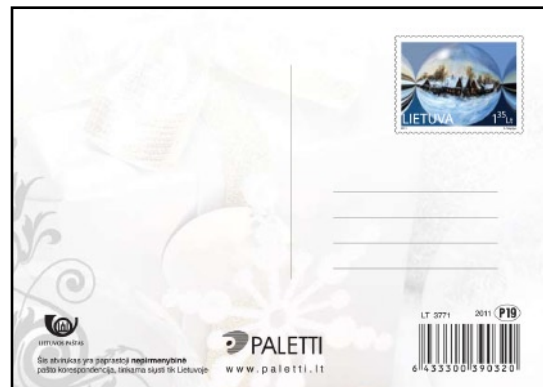
ZA 7 1,35 Lt – Kalėdų šventė.

Tiražas: po 0,010 mln. Spausdino UAB „Garsų pasaulis“.